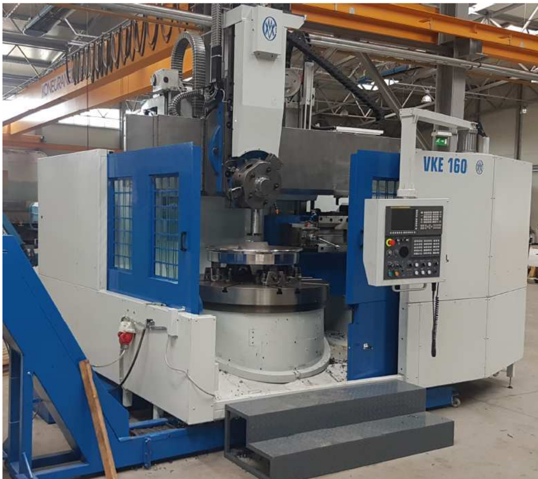
SOFÉM Kft. VKE 160

A társaság másik kiegészítő tevékenysége magában foglalja a korábban saját gyártású (Csepel Szerszámgépgyár, Csepel F+K Kft., Excel Csepel Kft.) gépek felújítását, modernizálását, továbbá a hasonló kategóriájú, de idegen gyártású gépek felújítását, átalakítását, amelyek szintén sikeres tevékenységnek tekinthetők.